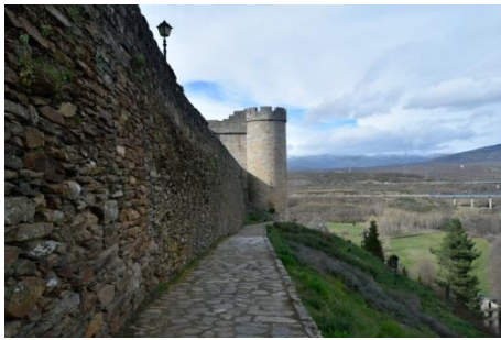
Vista lateral de la parte este de la muralla. En el fondo se observa una torre del castillo.