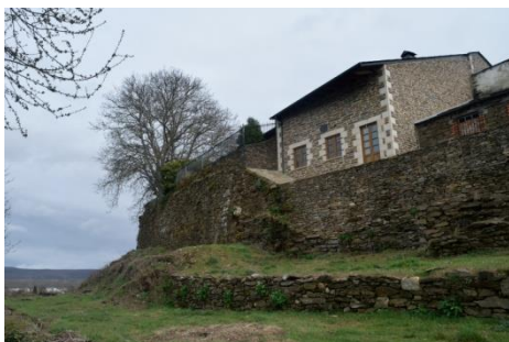
Imagen en la que se observan casas construidas justo al lado de las murallas. También se pueden observar muros de huertos, cubiertos de vegetación, que pueden ser arranques de las murallas.