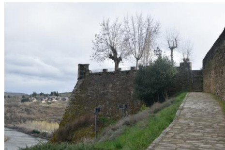
Vista lateral de la plataforma en talud, conocida como "de los Portugueses".